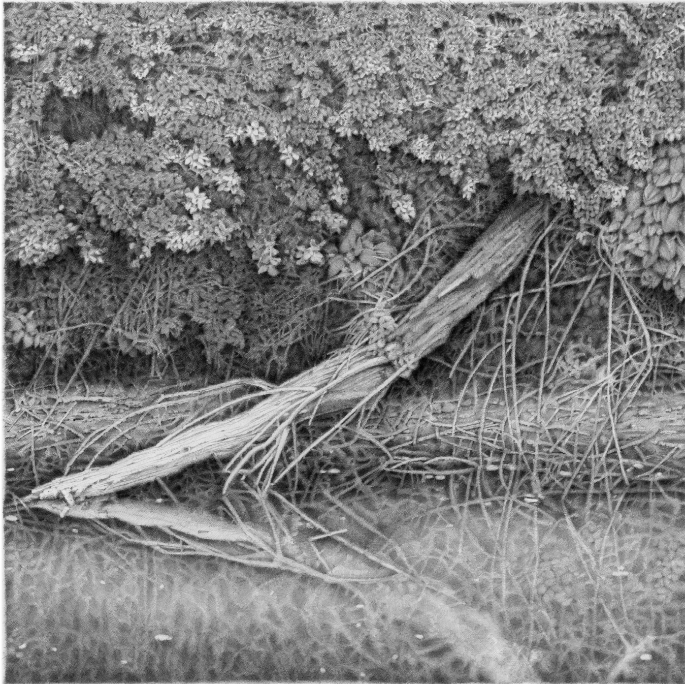
Das Ufer Bleistift auf Aquarellpapier 76x56 cm